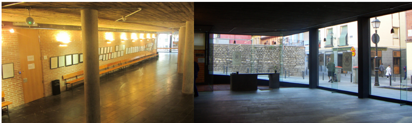
Sala de Exposiciones Escuelas Pías de Madrid