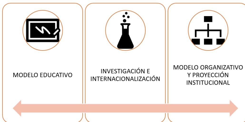
Figura 2. Estructura de las Orientaciones Estratégicas UNED 2018-2021