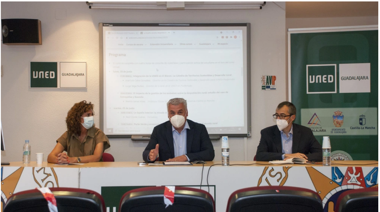
Culmina el curso sobre despoblación en la UNED

Este curso de verano tenía por título "La España vaciada: Despoblación y Desarrollo Rural"