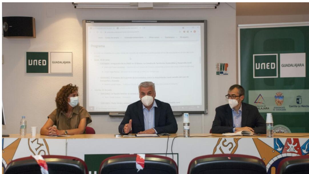
Seminario sobre la España vaciada en la UNED de Guadalajara.