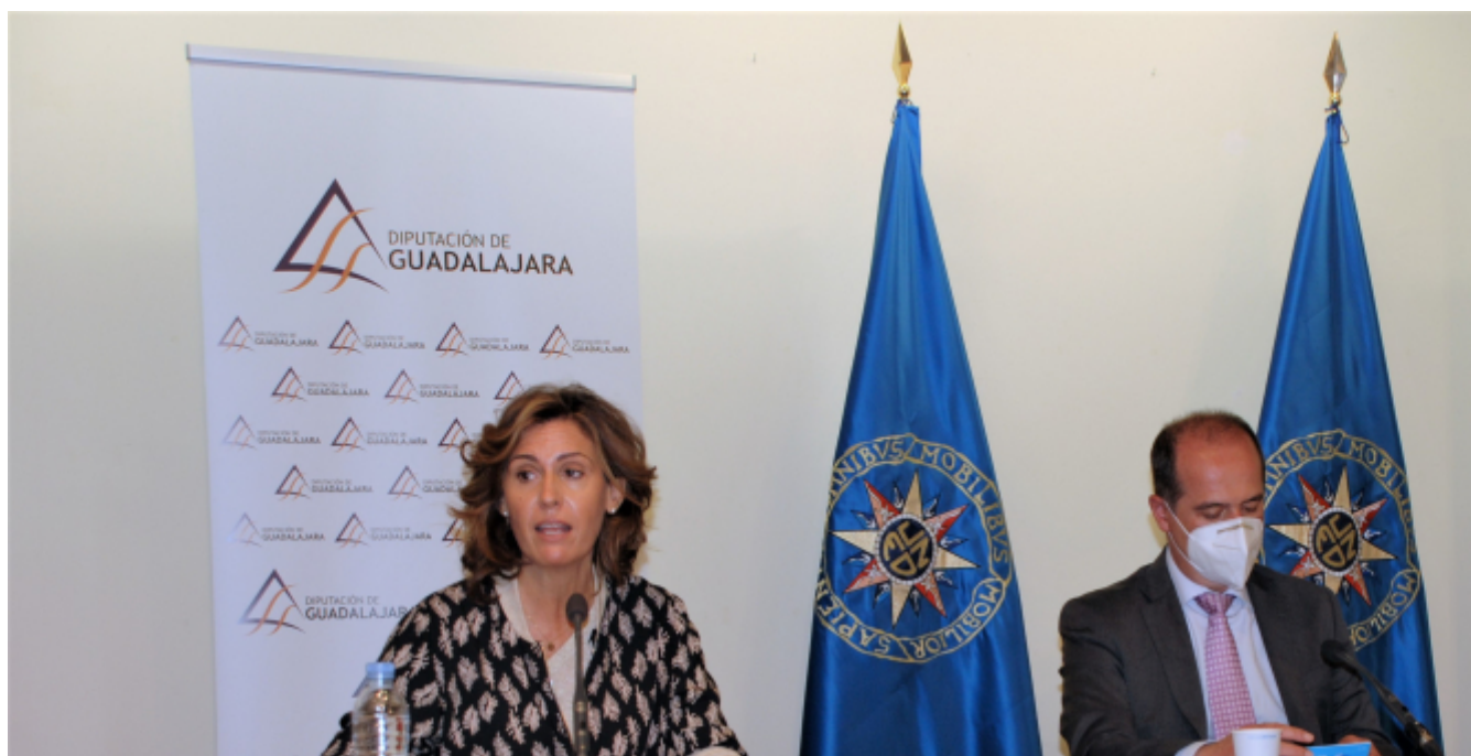
Presentación oficial de los cursos de verano 2021 de la UNED en Guadalajara.