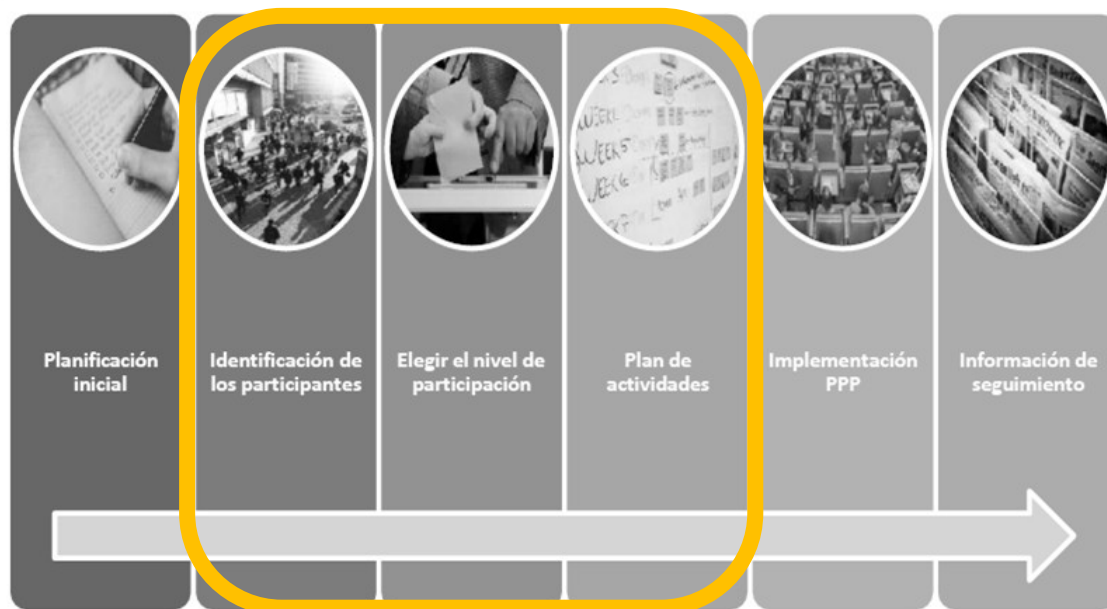
Figura 4. Etapas del proceso de participación ciudadana

En este sentido, considerando las seis etapas que tiene un plan de participación ciudadana, se definirán aportes para las etapas dos, tres y cuatro: identificación de las personas participantes, elección del nivel de participación y plan de actividades, respectivamente, identificadas en la siguiente figura.