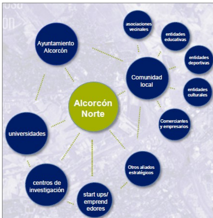
Figura 5. Mapeo de participación ciudadana en Alcorcón

Para realizar las actividades que se describieron anteriormente se confeccionó un mapa de actores (Figura 5) donde se aprecia que diversos grupos fueron identificados para ser convocados a lo largo del proceso. Si bien el mapa es abarcativo, incluyendo un amplio espectro social, cabe destacar que no se visualiza específicamente el registro de personas que no pertenezcan al municipio y hagan uso del mismo para alguna actividad. Tal vez podría señalarse como “comunidad de municipios colindantes” y allí se podría considerar que el mapeo considera la variable “jurisdiccional”.