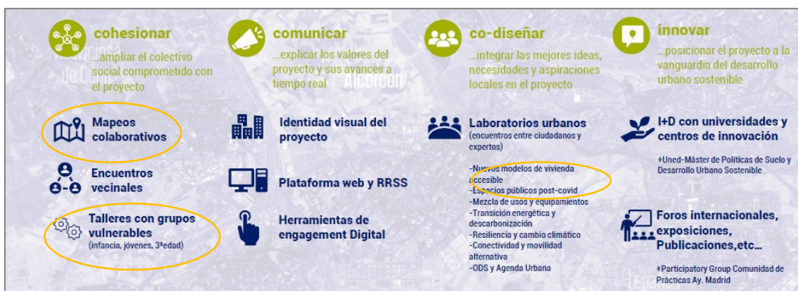
Figura 7. Plan de Participación. Hoja de Ruta 2022-2024.

Según lo planificado en el Diagnóstico de Participación Ciudadana de Alcorcón se prevén instancias de trabajo con grupos vulnerables (aunque no se especifica a las personas con discapacidad), se realizarán mapeos colaborativos, se desarrollarán laboratorios urbanos de distintas temáticas como los nuevos modelos de diseño de viviendas accesibles, entre otros tópicos (Figura 7).