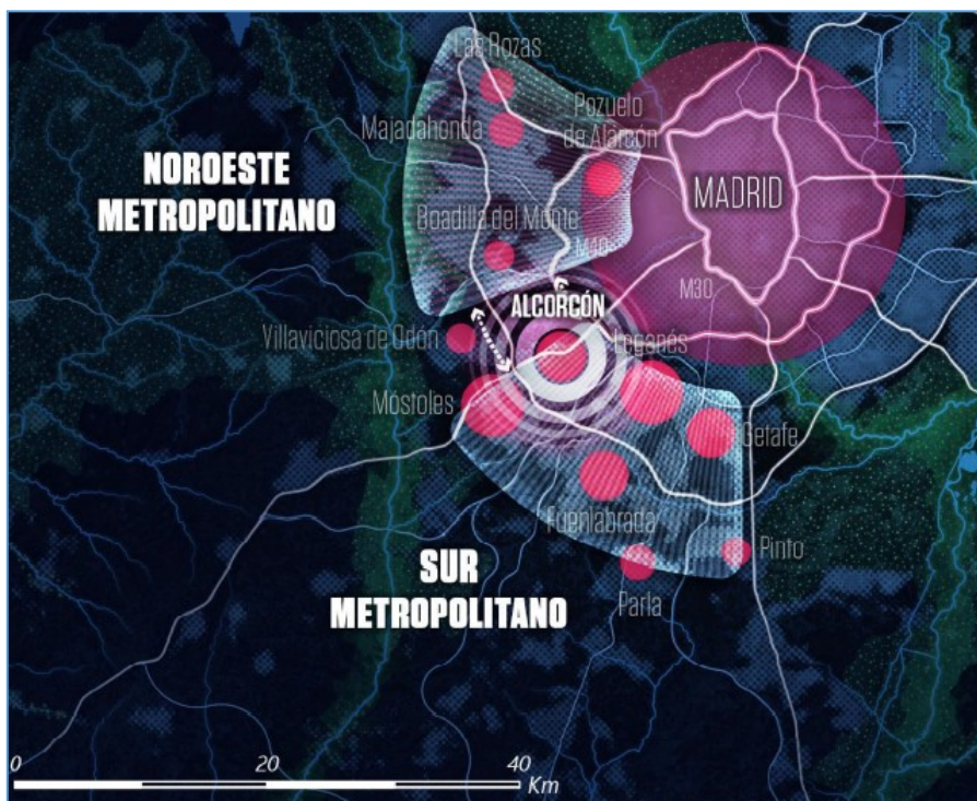
Figura 1. Localización del Distrito Norte de Alcorcón.

El municipio de Alcorcón, a 13 km del centro de Madrid, posee una población de 172.000 habitantes y se encuentra totalmente integrado en las dinámicas metropolitanas. La influencia del Distrito Norte de Alcorcón está determinada por las circunvalaciones metropolitanas M-40 y M-50, y las autovías A-5 y M-501. Los terrenos denominados como “Distrito Norte” se encuentran situados como su propio nombre indica al Norte del término municipal de Alcorcón. Delimitados físicamente al Norte por el núcleo urbano Ventorro del Cano, al Este por el límite del término municipal colindante con Madrid, al Sur por la vía de comunicación M-506, Avda. de San Martín de Valdeiglesias, y al Oeste por la carretera de circunvalación M-50. Su superficie total es de aproximadamente 1.214 ha. (Metrovacesa, 2011).