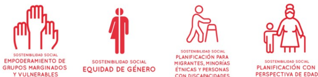
Figura 3. Las cuatro dimensiones de la sostenibilidad social

La Convención de las Naciones Unidas sobre los Derechos de las Personas con Discapacidad es un documento vinculante ratificado por España en el año 2007. Además, el Marco de las Ciudades y Comunidades Adaptadas a las Personas Mayores de la Organización Mundial de la Salud, los Objetivos de Desarrollo Sostenible y el Marco de Sendai para la Reducción del Riesgo de Desastres recogen todos ellos la necesidad de no dejar a nadie fuera y construir ciudades para todas las personas. Asimismo, la Nueva Agenda Urbana subraya la sostenibilidad social como elemento clave de todos los sectores y escalas involucradas en el desarrollo urbano. Sus cuatro dimensiones, presentadas en la figura 3, aseguran colectivamente la sostenibilidad y la accesibilidad universal y forman una lente a través de la cual se verá y evaluará toda la agenda del desarrollo urbano y sus sectores al ser de alcance universal (ONU-Hábitat, 2021).